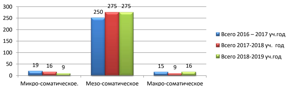
Распределение детей по группам физического развития за 3 года

Заб оле вае мо сть по дан ны м ста тот чет