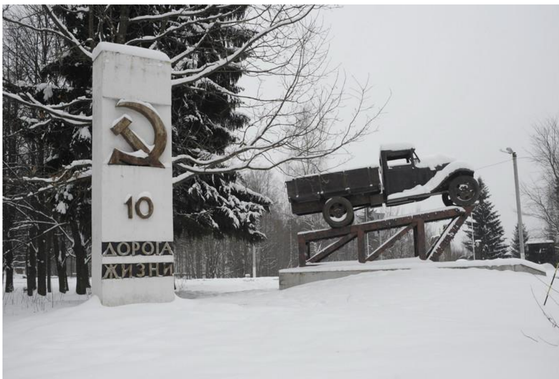
Это точная копия грузовика, в блокадные годы перевозившая сотни тонн грузов по ледовой Дороге жизни в Ленинград, и истощенных людей из осажденного Ленинграда. Этот памятник посвящен героизму водителей, которые ценой собственной жизни спасали родной город.