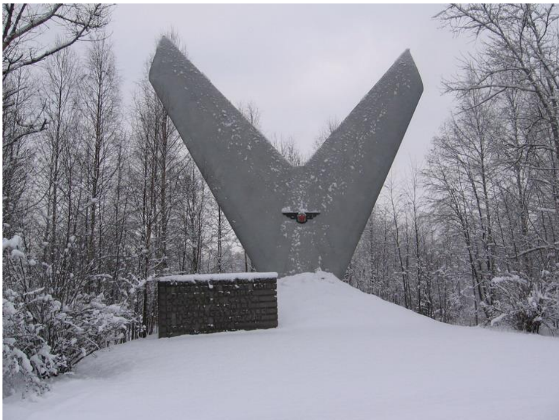
Подвиг летчиков, защищавших Л., увековечен в мемориале «Балтийские крылья», расположенном на 5-м км трассы