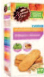
Полезный Завтрак. Имбирное с яблоками