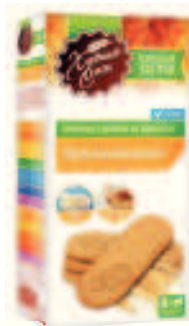
Полезный Завтрак. Мультизлаковое