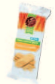
Полезный Завтрак. Мультизлаковое в индивидуальной упаковке